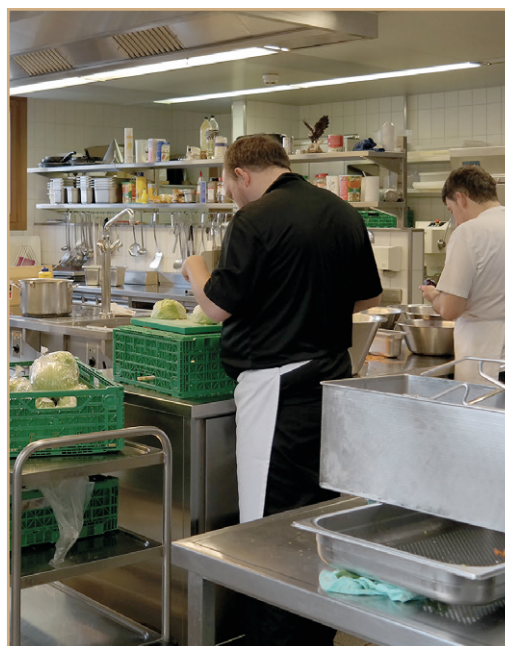
Bestens ausgestattete Küche in Ilanz