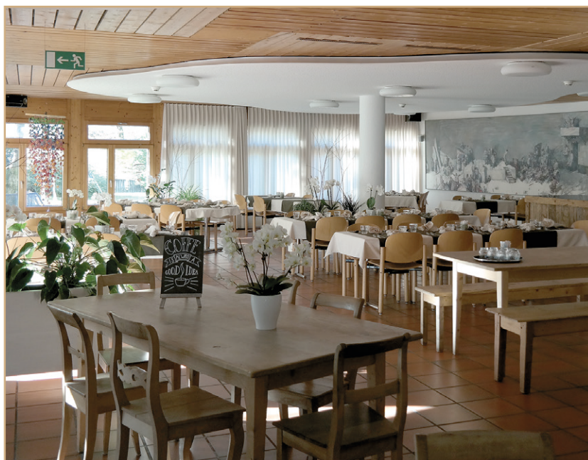
Café-Restaurant in Chur

Unsere Küchenchefs beraten Sie gerne persönlich bei der Durchführung Ihres besonderen Anlasses.