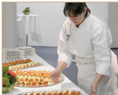
Catering-Service von A - Z